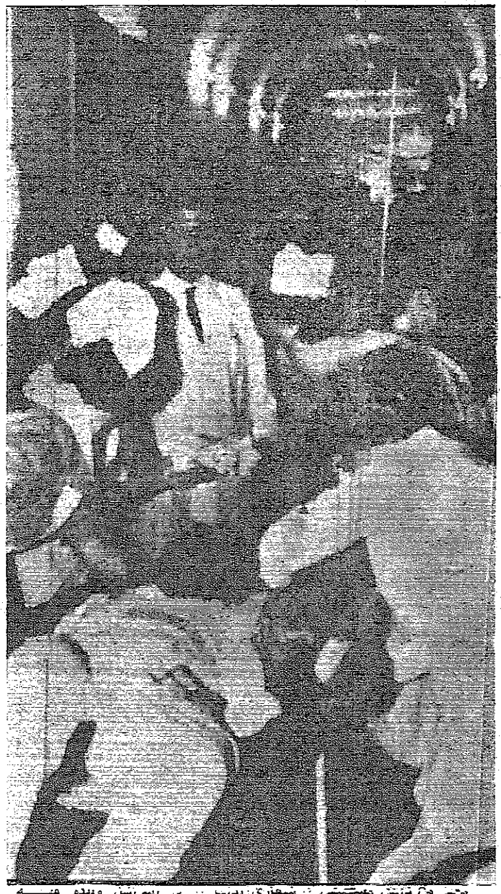
مجلس من قضاة محكمة... في عمان... يوم ١٢ يونيو... في ساحة خضراء القدس... بالاسم... بالاسم...